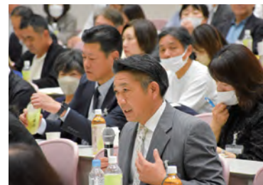
↑↓活発な意見や質問が出た