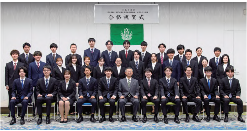
↑ 難関国家試験に合格した在学生と小海育友会長

※公認会計士試験合格者数、国家公務員採用総合職試験合格者数は2023年12月の数字です。更新されることもあります。