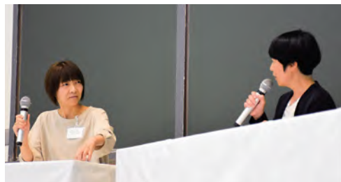
↑千葉西支部の待山前支部長（左）と佐藤副会長