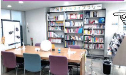
国際交流センター内 生田キャンパス9号館5階