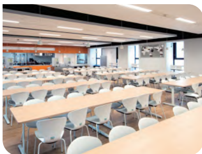
↑ 10号館学生ラウンジ(神田)

神田10号館学生ラウンジ(学食)のテーブル・椅子・世界時計・学食の飛沫防止パーティション、防災倉庫の寄贈、専大のシンボル黒門の復元など、様々な形で大学を支援しています。