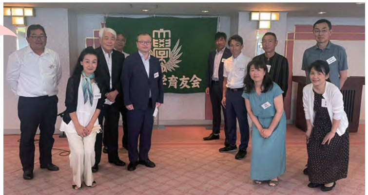
↑今年の支部懇談会にて（左端が私）