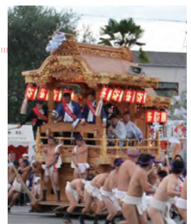
↑秋祭り。私も檀尻に乗っている

私の住む兵庫県南西部（播州地方）は秋祭りが盛んで、9月下旬～10月下旬にかけて各地域で順に行われる。私の地域の秋祭りは毎年10月21、22日で、小学生から50代までで地区の宝である檀尻を曳廻す。檀尻は重さ約3トン。この秋祭りも支部懇談会同様に、コロナ禍で2年間中止だったが、今年は開催する予定だ。