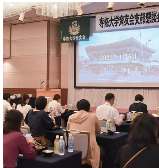
↑DVDを上映しながらの昼食会

群馬支部では支部懇談会に先立って7月にZoomによる交流会を開催し、支部会員同士の交流を図ったといいます。その交流会をきっかけに支部懇談会の参加につながることを目的としました。