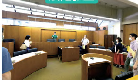
2号館地下1階 法廷教室