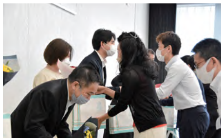
↑退任役員に記念品と花束贈呈