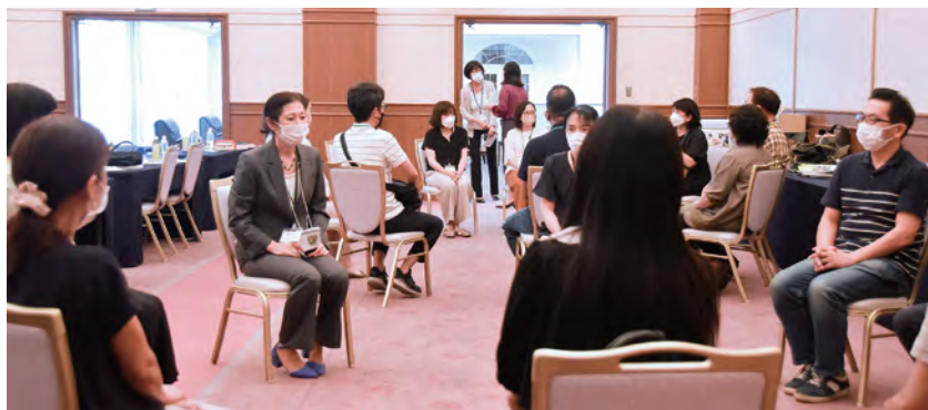
↑情報・意見交換会