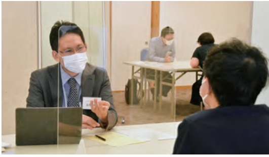
←個人面談 ↓グループ面談