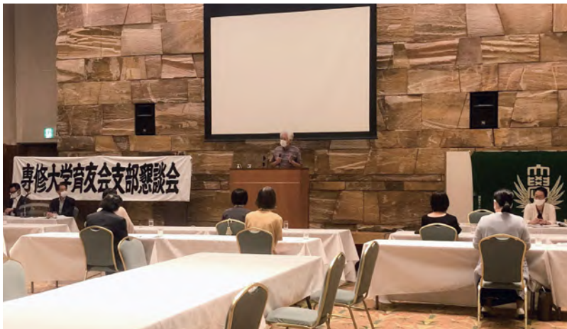
↑教職員による講演