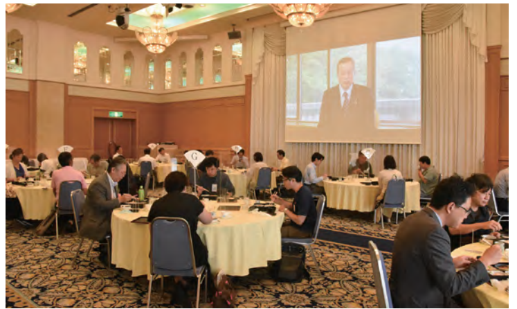
↑ DVD を上映しながらの昼食会

千葉みなと駅すぐ近く、海までも程近いホテルポートプラザちばが会場となった千葉東支部懇談会には26組35名のご父母・保護者が参加しました。コロナ禍により過去2年間にわたり開催できなかったため、今年開催には、ノウハウを知る支部役員OB・OGが協力されていました。