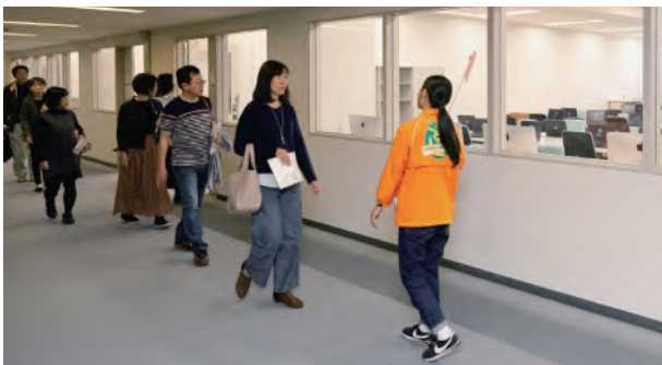
↑9号館4階の情報科学センターでは調べものやレポート作成など、学生が自由にパソコンを利用しています。