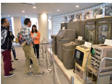
←情報科学センターに展 示されているこの巨大な 物体は、1961年に導入され た専修大学コンピュータ第 1号機です。専修大学は文 系大学でありながら早くか らコンピュータを導入し、 情報処理教育に力を入れて きました。