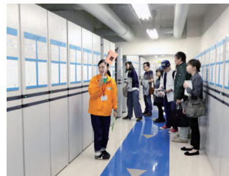
↑電動書架がずらりと並ぶ、 フロア。迷子になりそうで すが、床に記された矢印を 辿れば入り口に戻れます。