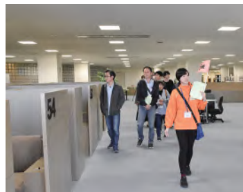
↑広々とした空間に、映像作 品を楽しむ鑑賞ブースが並 ぶ図書館4階アクティブラ ーニング・プラザです。