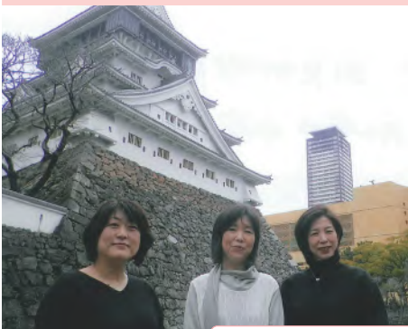
↑ 小倉城にて支部役員と

本州と海を挟んだ九州の玄関口北九州は、海の幸や山の幸に恵まれ、関門海峡タコやフグ、合馬のタケノコと四季折々の新鮮な食材が楽しめます。観光では、日本新三大夜景に選定された皿倉山からの眺望は素晴らしく、小倉城や門司港レトロ、世界中から観光客が集まる河内藤園など、一度行くと帰りたくなる素敵な場所がたくさんあります。