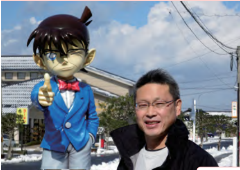
↑ JR 由良駅前でのコナン像と

本年度こそは、新会員の歓迎会と今夏開催予定のシブコンに向けてにぎやかな活動を目指したいと考えています。たくさんの方との出会いを楽しみにしています。