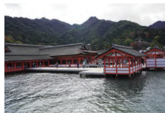
↑安芸の宮島(厳島神社)