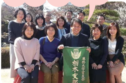
3月の役員会（前列中央が私）