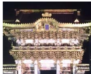
↑日光東照宮「夜の陽明門」

栃木県には、那須、鬼怒川、塩原など、多くの温泉地をはじめ、観光地（名所）もあります。しかも、栃木県と言えば世界遺産に登録されている「日光東照宮」ですね。グルメも多く、消費量日本一の「宇都宮餃子」、生産量日本一の「いちご」（とちおとめなど）、そして、私のいち推しは、全国納豆鑑評会で受賞もしている、あさひ納豆の「味百年」や「中粒納豆」です。どうぞ皆さん、一度ご賞味あれ！