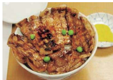
「ばんちょう」（帯広駅前）の豚丼→

ジャガイモ・トウモロコシといった農産物はもちろんですが、帯広は「豚丼」発祥の地として有名です。ほかには「六花亭」「柳月」といったお菓子屋さんかな。